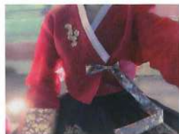
文化体験で伝統衣装のチマチョゴリを着ました♪