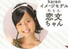
karen イメージモデル れもん 恋文 ちゃん

各店舗に通われているLittle Ladyをご紹介しますコーナー♡誌面に登場いただけるLittle Ladyも、随時募集中です！