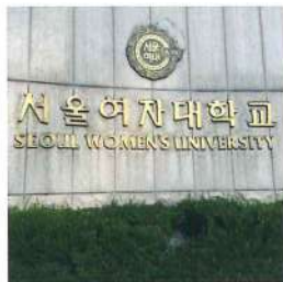
研修先のソウル女子大学

韓国だけでなくジャニーズやアニメなど色々なことに興味があるので、皆様のハマっていることもぜひ教えてください♡